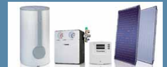
Bosch cuenta con una amplia gama de accesorios que complementan la instalación solar.