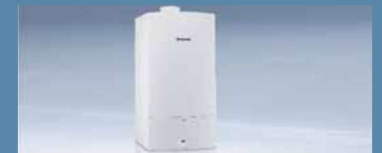
Sistemas de apoyo para el precalentamiento de agua sanitaria con calidad Bosch.