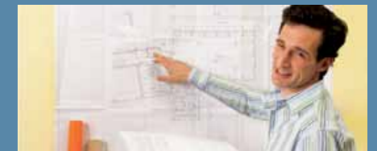
Departamento de ingeniería capaz de desarrollar cualquier tipo de proyecto solar térmico.

Calderas y calentadores a gas permiten complementar las instalaciones solares térmicas de manera eficiente gracias a la posibilidad de programación de su funcionamiento, lo que permite que el equipo entre en operación sólo cuando se requiere, sin incurrir en un gasto energético innecesario al mantener el agua a una temperatura definida en todo horario tal como ocurre con los termos convencionales.