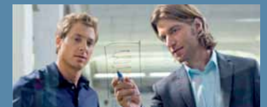
Inversión constante en Investigación y Desarrollo.