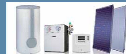
Bosch cuenta con una amplia gama de accesorios que complementan la instalación solar.