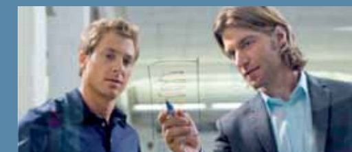
Inversión constante en Investigación y Desarrollo.