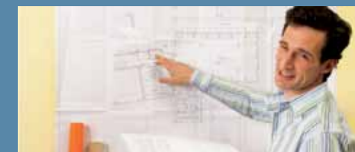
Departamento de ingeniería capaz de desarrollar cualquier tipo de proyecto solar térmico.

Reducir el gasto energético, disminuir la emisión de gases tóxicos y contribuir con la descontaminación del medio ambiente, se ha transformado hoy en un desafío permanente para empresas mineras. Bosch Termotecnología ofrece una amplia gama de equipos de energía solar para el diseño de sistemas a la medida de cada necesidad, lo que permite minimizar las emisiones de CO 2 y disminuir de manera significativa el consumo de combustible fósil requerido para la producción de agua caliente.