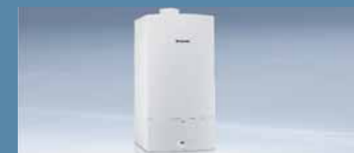
Sistemas de apoyo para el precalentamiento de agua sanitaria con calidad Bosch.